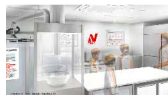
「冷凍食品開発センター」のイメージ

キッザニア東京のパビリオン「食品開発センター」は、外観や内装を全面的に刷新し、先進的な「冷凍食品開発センター」として10月