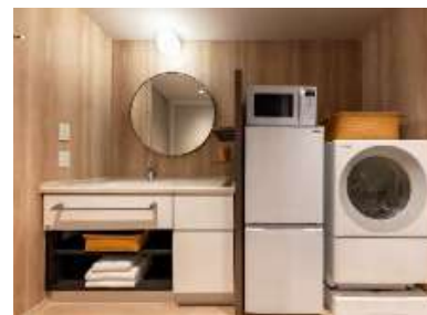
洗濯乾燥機、電子レンジ、冷凍冷蔵庫を完備する

三井不動産と三井不動産ホテルマネジメントは「三井ガーデンホテル銀座築地」を東京都中央区に30日開業する。全183の客室に洗濯乾燥機、電子レンジ、冷凍冷蔵庫を完備する。国内外に34カ所ある同ホテルでは初めて。