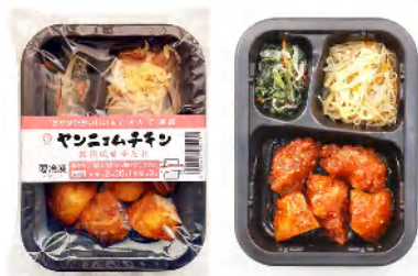
冷凍弁当の「ヤンニョムチキン」

メニューは「鯖のみぞれ煮」や「自家製デミグラスハンバーグ」、「ヤンニョムチキン」など和洋、アジアメニューをラインナップ。容器に主菜1品と副菜2品が入る。「鯖のみぞれ煮」は副菜に高野豆腐とえんどう豆の卵とじ、切り干し大根煮を詰め合わせた。「鯖竜田揚げの野菜あんかけ」の副菜はかぼちゃの鶏そぼろあんかけ、小松菜とじゃこの煮びたし。